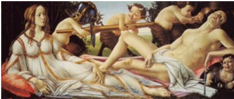
لوحة فنية تظهر أفروديت مع أريس.

ولكن الفنان السوري جعل من هذا الحب حباً طاهراً لأنه من غير المعقول أن تتزوج فتاة جميلة ولطيفة من رجل عجوز، وهذا ما تظهره اللوحة الفسيفسائية. حيث نلاحظ وجود شهود على أن هذا الحب حب طاهر، بينما تقف الوصيصة خاريس بطرف ومربية أريس بالطرف الآخر، وفي أعلى اللوحة نلاحظ إيروس إله الحب وهو يجمع الرأسين مع بعضهما جاعلاً هذا الحب حباً طاهراً بدلاً من أن يكون حباً دنساً.