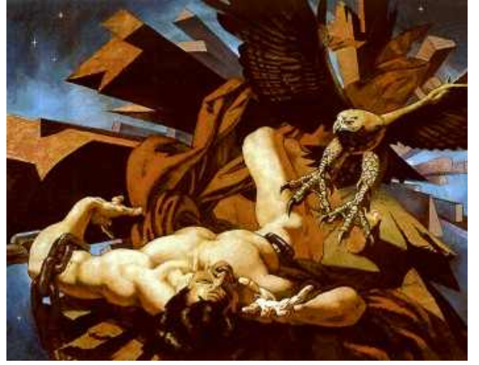
تمثال لبروميتيوس (في الأيسر) ولوحة تظهر النسر وهو يأكل أحشاءه (في اليمين).