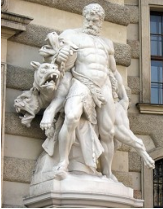
تمثال لهرقل يظهر صراعه مع الهيدرا

تظهر اللوحة الفسيفسائية 4 أو 5 أعمال لهرقل، وللأسف فإن السجادة ليست كاملة. في اللوحة الأولى يظهر كيف قتل هرقل الأفعى. في اللوحة الثانية يظهر كيف قتل هرقل الأفعى الأسطورية هيدرا ذات التسعة رؤوس، والتي كانت كلما يقطع لها رأس ينمو مكانه رأسان. في اللوحة الثالثة يظهر كيف نظف إسطبلات الملك أوجياس الذي كان يمتلك 3 آلاف رأس خيل والكثير من الأبقار في يوم واحد، وذلك بتسليط نهري ألفيوس وبنبيوس عليها. في اللوحة الرابعة يظهر كيف جلب تفاحات الهسبيريد، حيث ذهب إلى الغرب وهناك ضرب بعصاه فاصلاً أوروبا عن إفريقيا بمضيق يسمى عند اليونان مضيق هرقل، ونحن نسيمة الآن مضيق جبل طارق، بينما سماه الكنعانيون مضيق الإله ملك المدينة (مقارت). وعندها وصل إلى أطلس حامل الكرة الأرضية وطلب منه أن يدلّه على جنة الهسبيريد ليحضر التفاحات الذهبية إلى الملك يورستيسوس، وضك عليه وذهب إلى جنة الهسبيريد واستولى على التفاحات الذهبية.